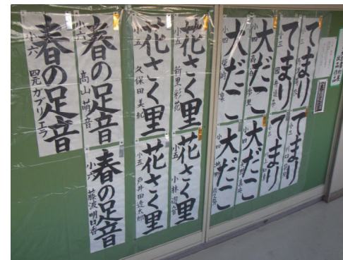
東松山市書き初め展覧会出品作品

1月23日(土)、24日(日)の2日間、新明小学校を会場に東松山市書き初め展覧会が開催されました。それに向けて、本校児童も、1月14日(木)には、3年生は教室で、4年生以上は体育館で競書会を行いました。どの児童も真剣に取り組んでいました。また、選手に選ばれた児童は2日間の練習会にも参加しました。どの作品もとても素晴らしいできばえとなりました(写真)。